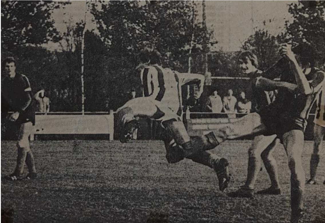
Een spelmoment uit de wedstrijd Juliana - DES