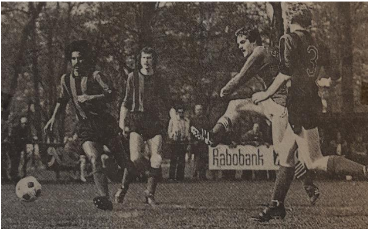
Een aanval van Hulzense Boys op het doel van DES (gestreept shirt). De gasten wonnen verrassend.