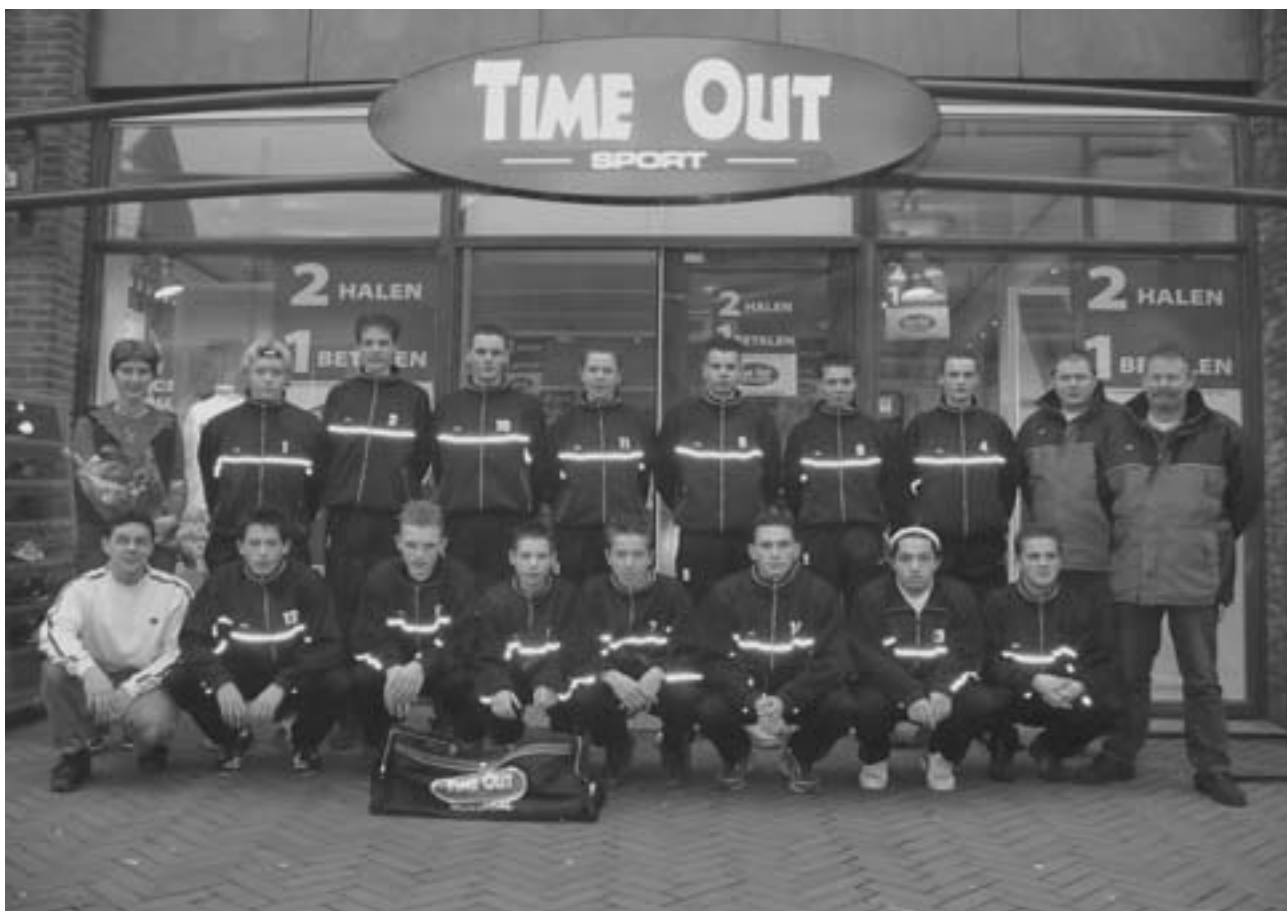
D.E.S. B1 in haar nieuwe trainingspakken voor de winkel van Time Out aan het Keizerserf

D.E.S. B1 heeft nieuwe trainingspakken gekregen van Time Out Sport Nijverdal. Time Out Sport Nijverdal is nu ongeveer zes maanden gevestigd aan het Keizerserf. Volgens eigenaar Karel Feteris, zelf sportliefhebber pur sang, kunnen we zijn zaak niet puur omschrijven als een sportzaak. 'Het is meer een winkel die het midden houdt tussen een sportzaak en een modewinkel'. Naast het sponsoren van D.E.S. B1 kunnen de leden op vertoon van hun ledenpas 10% korting krijgen op voetbalkleding, voetbalschoenen en accessoires.